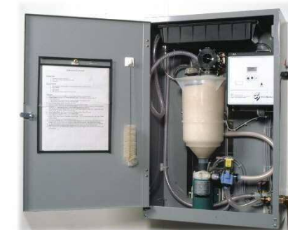
排水処理システム バイオアンプ